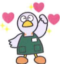
埼玉県マスコット「コバトン」